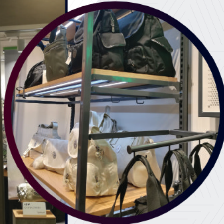
Adaptación en equipamiento existente

En el Retail la iluminación cumple un papel fundamental al ser capaz no solo de destacar el producto, sino también de generar un “ambiente” donde el cliente se sienta a gusto aumentando su tiempo de permanencia en la tienda y como consecuencia aumentando las ventas. El diferencial de nuestros productos es su simplicidad de diseño y montaje.